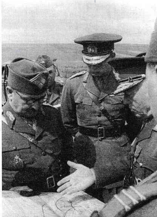
Regele Mihai I și generalul Ion Antonescu pe frontul din Basarabia.

armatele Frontului 2 ucrainean (27, 40, 53 de arme întrunite, 6 de tancuri și 7 de gardă) au contribuit la eliberarea părții de nord-vest a României și la anularea raptului teritorial ungar din august 1940, săvârșit cu sprijinul Germaniei și Italiei. De asemenea, ar fi greșit să se creadă că relațiile de comandament româno-germane și româno-sovietice au fost tot timpul tensionate, că în permanență aliații au urmărit să își impună cu orice preț punctele de vedere, că propriile comandamente nu au făcut nici o greșală 24 .